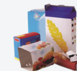
Toutes les Cartonnettes < inf 50 x 50 cm