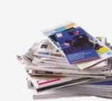
Tous les Papiers

Je dépose mes PAPIERS - CARTONNETTES en vrac dans les bornes dédiées à cet effet.